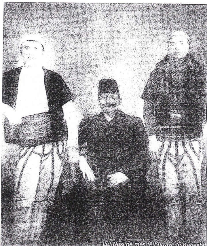
Lef Nosi ne mes dy burra kabashas