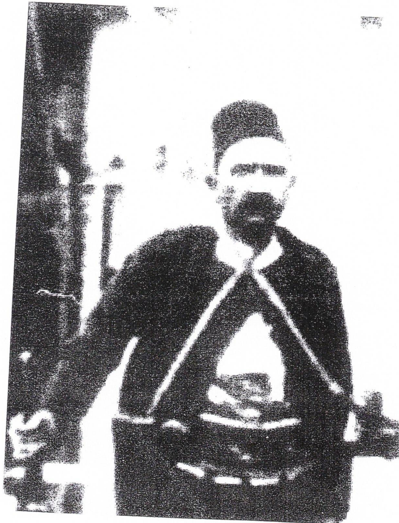
Haxhi Rustë Kabashi

Rustem Kabashi (Rustë Kabashi) 1835-1910